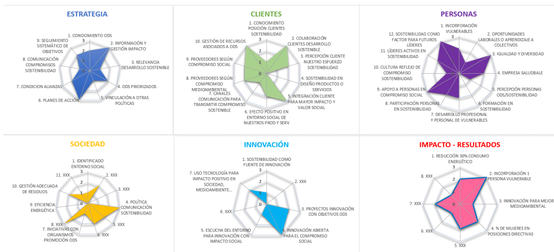
Imagen de la herramienta web. Grado de avance en cada uno de los elementos